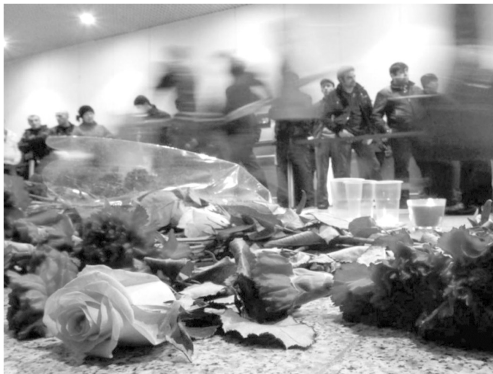
Уважаемые Волжане! При получении информации об угрозе террористического акта обезопасьте свое жилище

Управление по делам ГО и ЧС администрации городского округа – г. Волжский